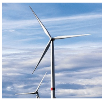
In Oberveischede wächst die Sorge, möglicherweise bald von Windrädern umzingelt zu sein.

Die wichtigste Frage aber war, wie diese Gegenwehr organisiert und eine mögliche Klage finanziert werden soll.