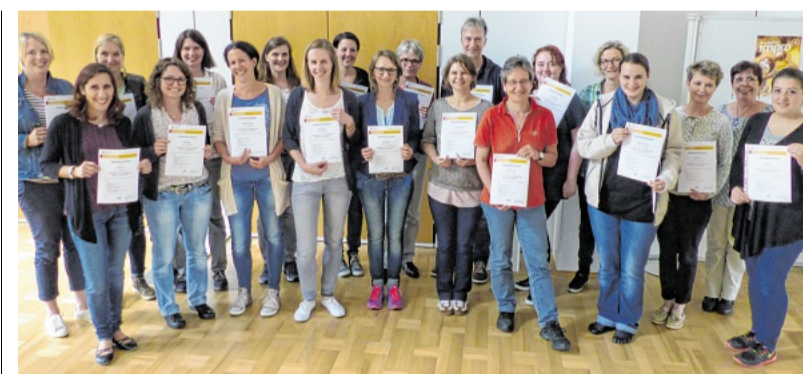
Fortbildung erfolgreich beendet: Zum Abschluss der Weiterbildung gibt es für alle Teilnehmer auch ein Zertifikat.