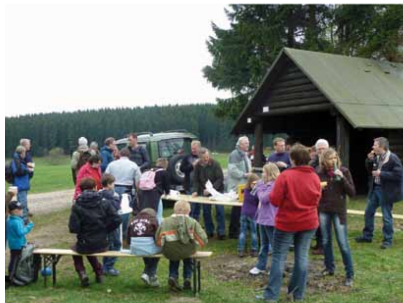
Rast oberhalb Rahrbach