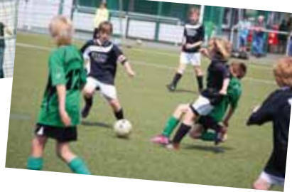
Unsere jungen Fußballerinnen und Fußballer konnten sich in den verschiedenen Spielgemeinschaften gut behaupten.