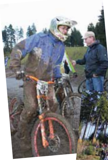
Die Froerider bringen mit ihren „Rasenrennen“ eine überregionale Veranstaltung an den Start.