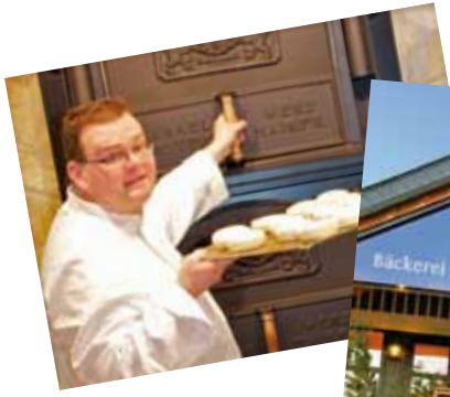
Die Landbäckerei Sangermann eröffnet ihren „Backes“.