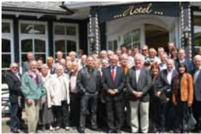
Internationale Gäste konnten im Rahmen der Europäischen Städtepartnerschaftskonferenz in Oberveischede begrüßt werden.